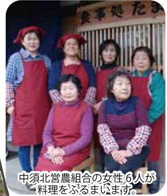
中須北宮農組合の女性 6 人が料理をふるまいます。

お店の名前は、地元で募集し、応募数 40 提案の中から決定！棚田清流の会のキャラクター名「たまちゃん」に由来しています。