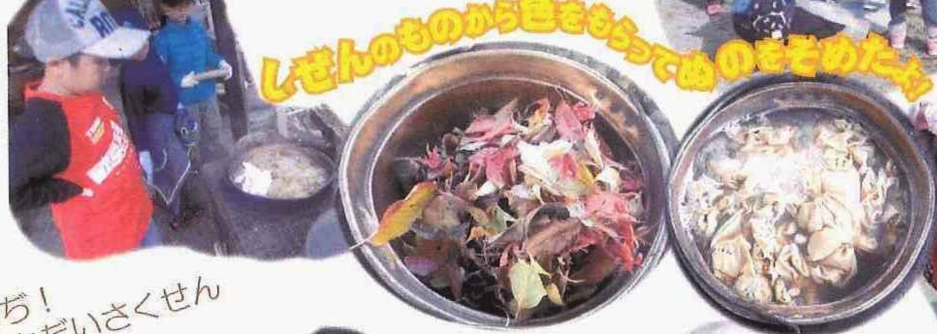
しぜんいろネームボタンづくり

さいしょはどきどきしていたけど、きんちょう せずにみんなとあそべて楽しかったです