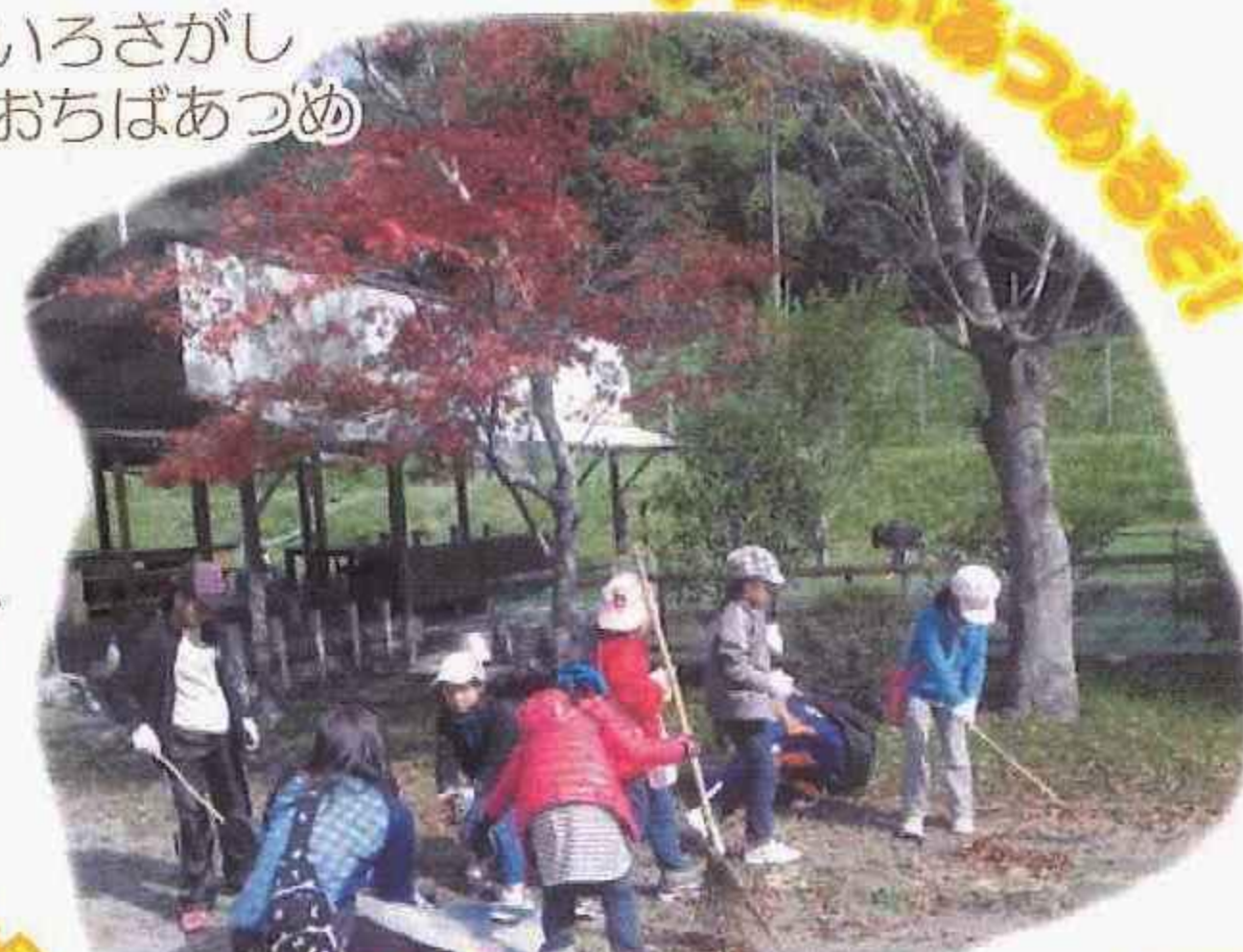
いろさがし おちばあつめ

心たのこったのははじめに入村式でみんなの前 で代表として楽しみな事を発表したことです。 とてもドキドキしていやだったけど、とてもい いけいけんになりました。