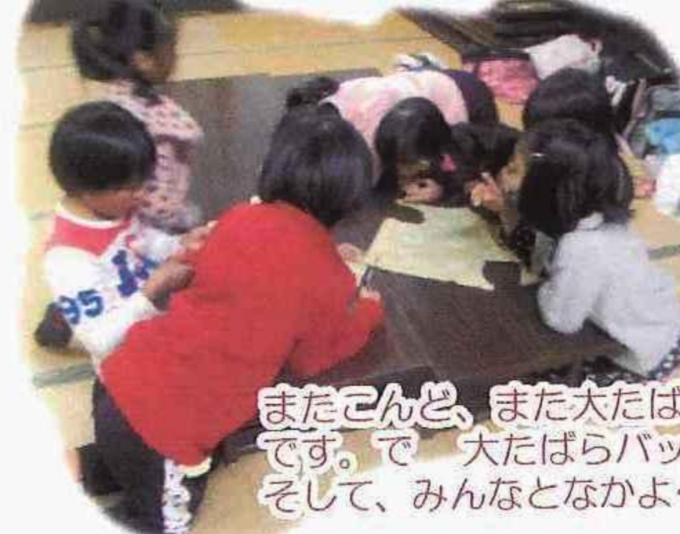
しぜんいろネームボタンづくり

またこんど、また大たばらにきてとまりたい です。で 大たばらパッチをつくりたいです。 そして、みんなとなかよくしたいです。