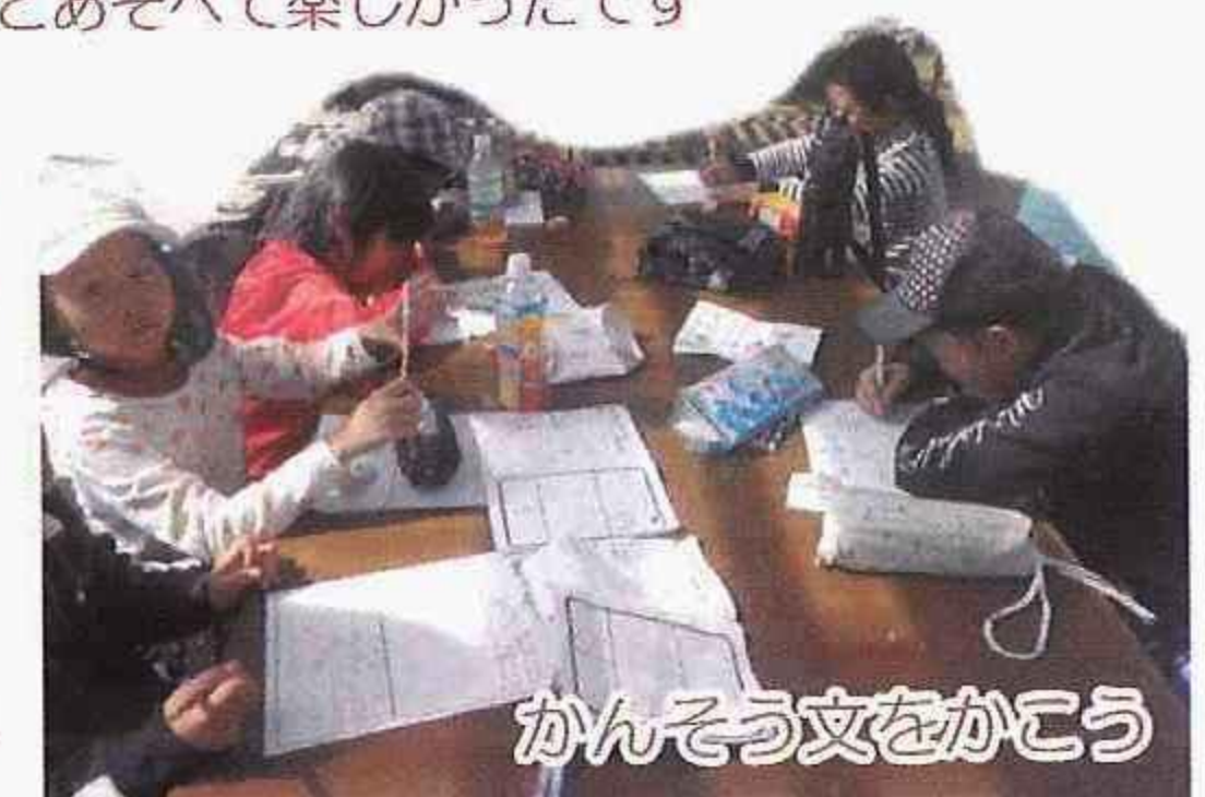
かんそう文をかこう

やまびこがやりたくてやりたく ても、ほくの家は山が近く にないでやれなかつたけど、 やまびこができてすごうれ しかったです。