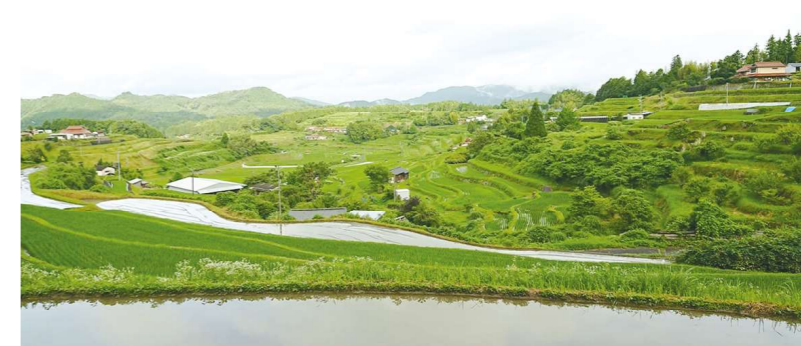
中須北の棚田 (中須地区)